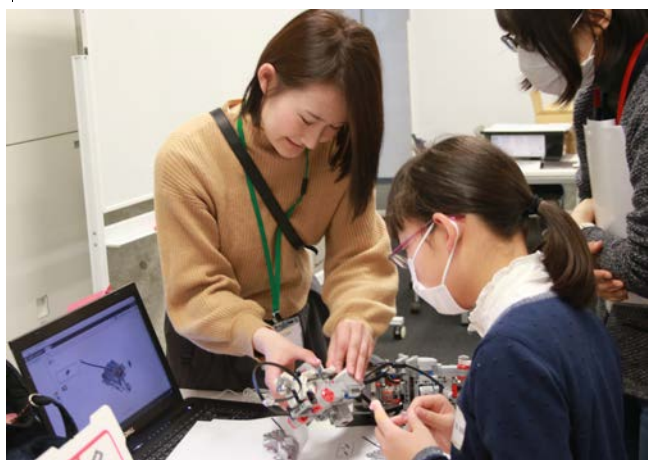
ロボットの組み立てを指導する様子

芝浦工業大学では、女子学生を対象に、まだロールモデルが少ない工学女子を育成する目的で女性教員などによる“工学女子を育てよう！プロジェクト”を実施しており、ものづくり教育やリーダーシップ能力養成などの取り組みを行っています。今回の講座はその一環として、プログラミングを学んだ女子学生が成果発表と後輩にもものづくりを伝える活動とあわせて、女子中学生への講師役を務めました。