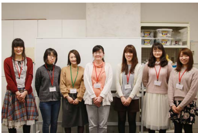
講師を務めた“工学女子を育てよう！プロジェクト”女子学生7名